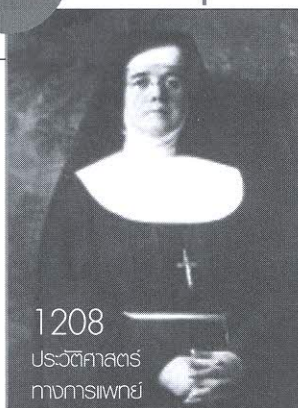
1208 ประวัติศาสตร์ ทางการพยาบาล