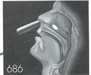
686 การผ่าตัดสำหรับผู้ป่วยโรคเบา หวานภูมิแพ้

755 แพทย์กับกระบวนการค้นใหม่ แม่ช่างอาชีพ ชลทิพย์ วีระชาติสกุล, สายพิน หัตถิรัตน์