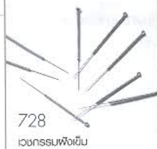
728 เวชกรรมฝังเข็ม