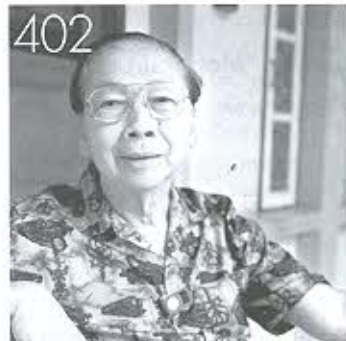
402 ครูใหญ่แห่งงานสาธารณสุขมูลฐาน และบิดาแห่ง อสม.