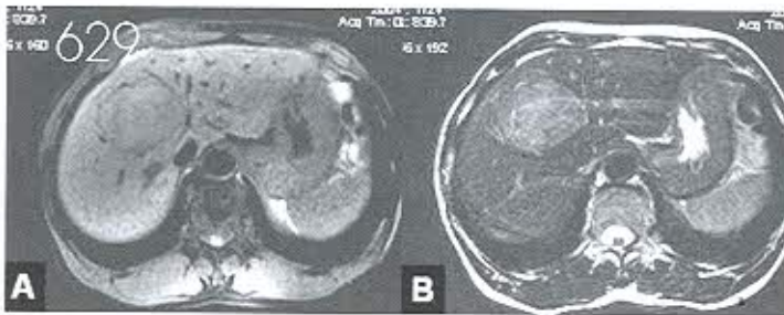
แนวทางการตรวจคัดกรองวินิจฉัยและรักษาโรคมะเร็งตับและท่อน้ำดี

661 ปังอิมพากย์ เคมเนตี้ ตามความหมาย เออี ไพบูลย์ สุริยะวงศ์ไพศาล