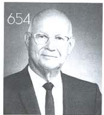
“เตียงสำหรับผู้ป่วยกระดูกสันหลังหัก (Stryker turning frame)”

คลินิก : เป็นหนึ่งใน “โครงการเผยแพร่ความรู้ทางสิ่งพิมพ์” ของมูลนิธิหมอชาวบ้านที่ประมวลความรู้ทางเวชปฏิบัติและการใช้ยาสำหรับผู้ประกอบเวชปฏิบัติ ทุกสาขา จัดพิมพ์โดยสำนักพิมพ์หมอชาวบ้าน เป็นวารสารรายเดือน จัดส่งให้แก่ผู้ที่ยกเว้นเป็นสมาชิกในอาชีพที่เกี่ยวข้องเท่านั้น บทความ : บทความ ต่างๆ ที่ปรากฏในวารสารคลินิก เขียนโดยกองบรรณาธิการและผู้เชี่ยวชาญที่ทรงคุณวุฒิต่างๆ เพื่อให้ “เป็นความรู้ที่ทันสมัย ถูกต้อง กระชับ และ ประยุกต์ใช้งานได้” ดัชนีฉบับ : ติดต่อดังต้นฉบับมาได้ ที่ นายแพทย์สุรเกียรติ์ อารานานุกาฬ 36/6 ซอยประดิพัทธ์ 10 ถนนประดิพัทธ์ แขวงสามเสนใน เขต พญาไท กรุงเทพฯ 10400 โทรศัพท์ 0-2618-4710, 0-2618-6391 ต่อ 30 โทรสาร 0-2271-1806. ส่งทาง E-mail : nattayasu@hotmail.com , บทความต่างๆ ที่ตีพิมพ์ในวารสารคลินิกถือเป็นลิขสิทธิ์ของวารสารฯ และผู้เขียน ห้ามนำไปเผยแพร่โดยไม่ได้รับอนุญาต