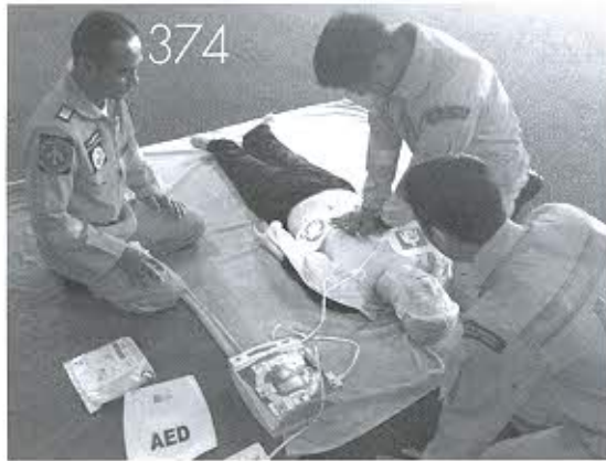
Public Access Defibrillation (PAD)