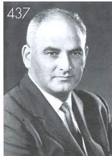
“บิดาแห่ง diastolic augmentation”