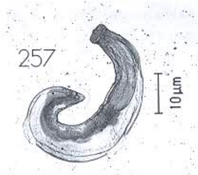
พยาธิตัวจิ๋ว (Gnathostoma spinigerum)