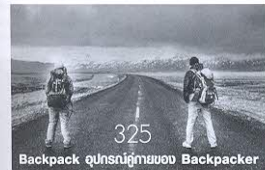
Backpack อุณหภูมิร่างกายของ Backpacker