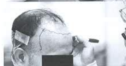
แนวทางในการรักษาโรคผมบางชาย