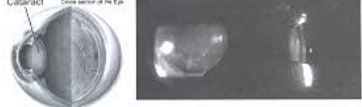
Cataract Cross section of the Eye

ลักษณะของน้ำไขสันหลังในโรคติดเชื้อของระบบ ประสาทส่วนกลาง/ 780