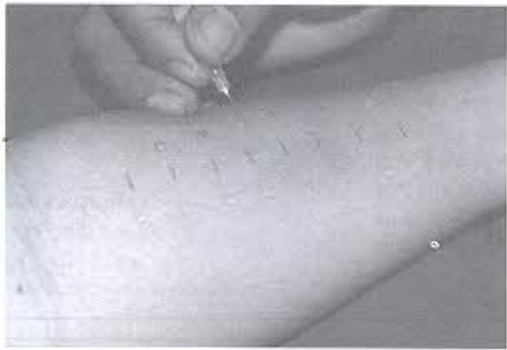
การทดสอบภูมิแพ้ทางผิวหนัง (allergy skin test): วิธีสะกิด (skin prick test)

✓ จะทราบได้อย่างไรว่าเป็นโรคภูมิแพ้หรือไม่/ ปารยะ อาศนะเสน 434