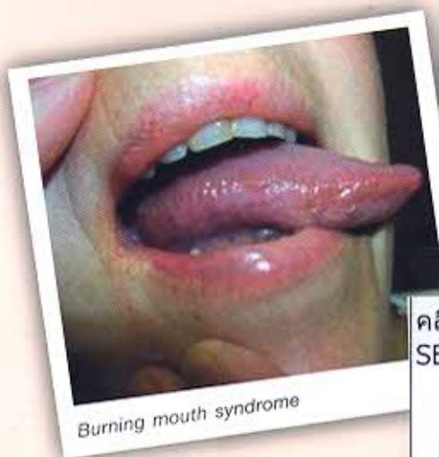
Burning mouth syndrome