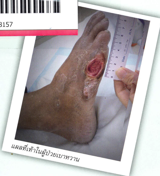
แผลที่เท้าในผู้ป่วยเบาหวาน