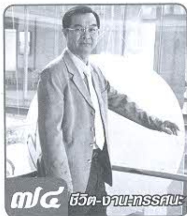
๗๑ ชีวิต-งาน-ทรรคนะ