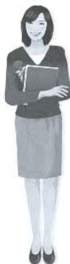
คลินิกรจิตแพทย์ ๕๘ กรรมตามทัน