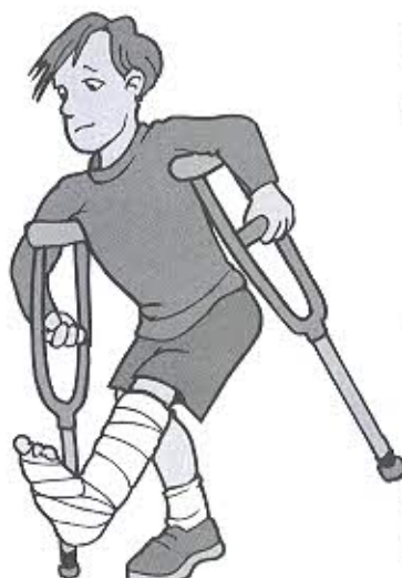
คลินิกจิตแพทย์