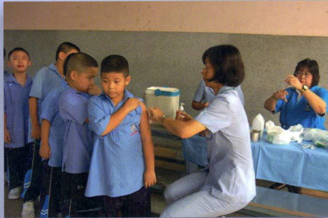
สถาบันวัดชินแห่งชาติ กรมควบคุมโรค กระทรวงสาธารณสุข